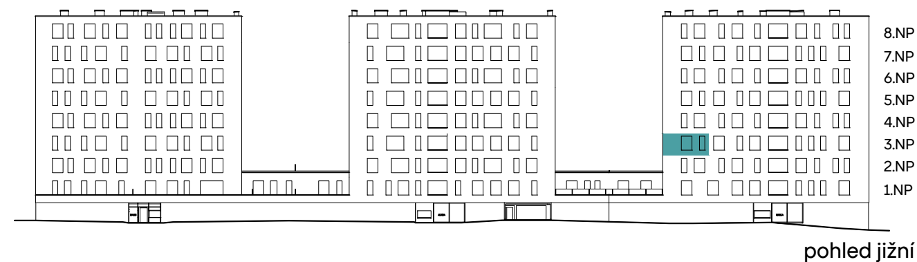
sekce K - Kamila