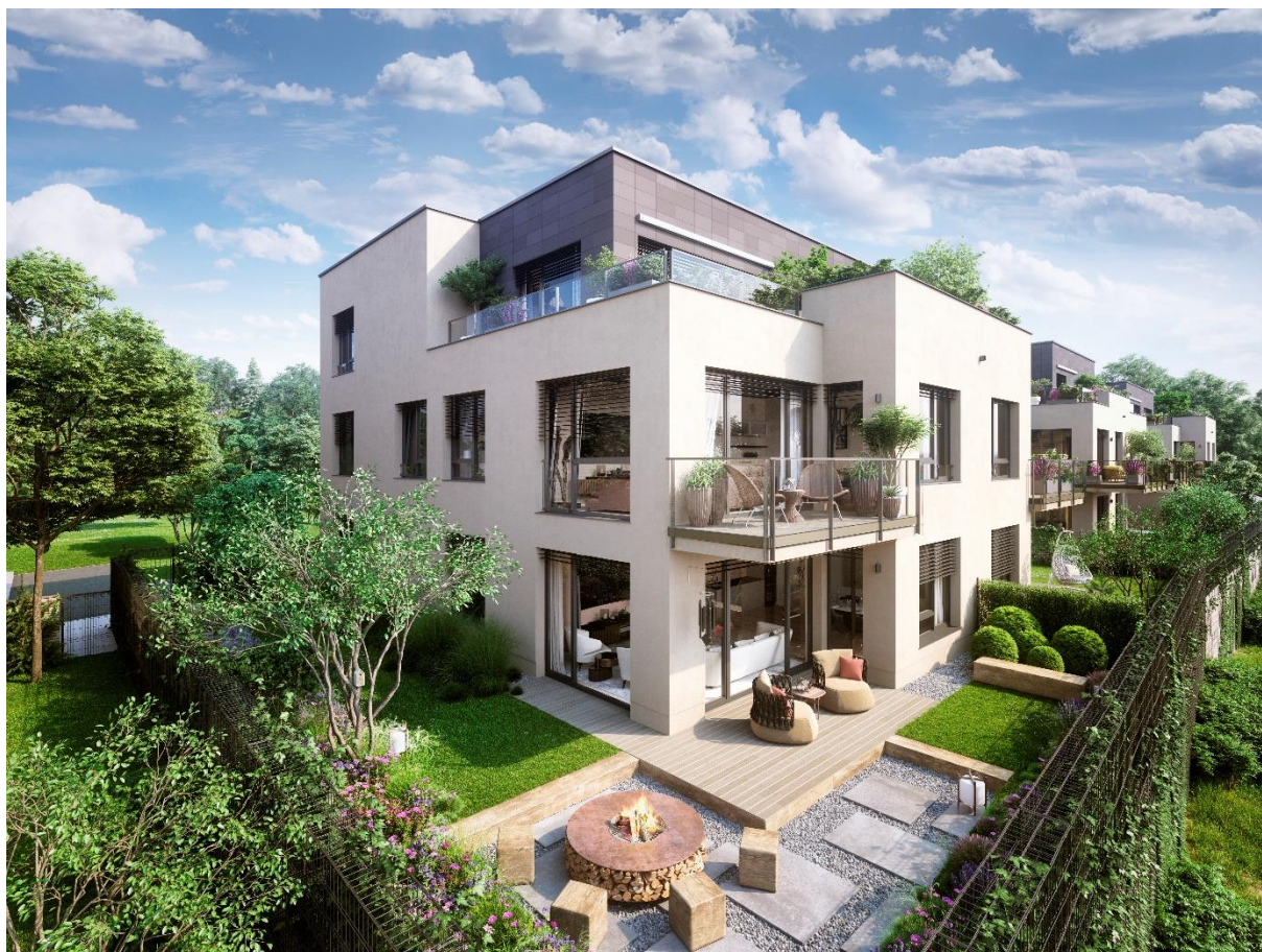
Vizualizace exteriéru projektu Čertův vršek

Stáhněte si fotogalerii v kvalitním rozlišení kliknutím na tento odkaz.