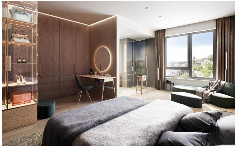
Vizualizace interiérové ložnice projektu Čertův vršek