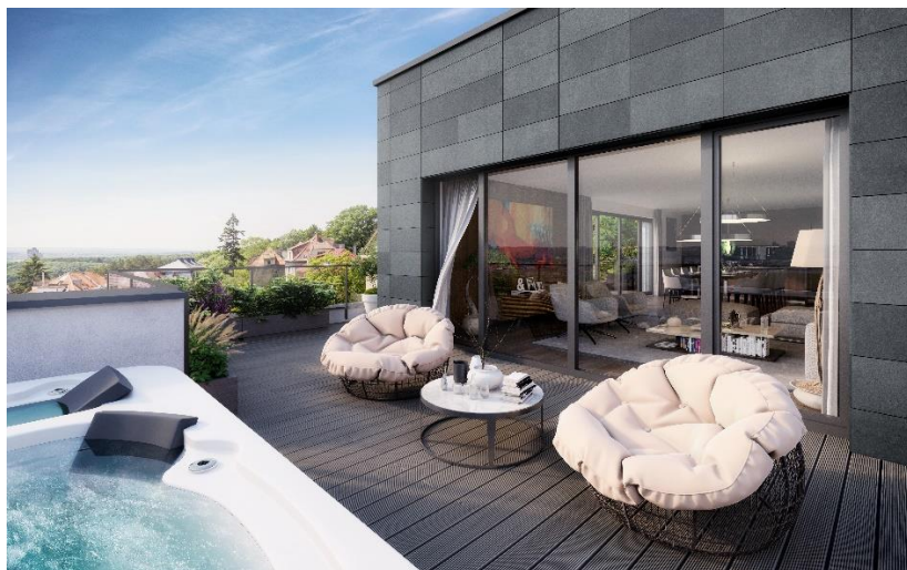
Na terase posledního patra si klient může nechat nainstalovat například privátní vířivku