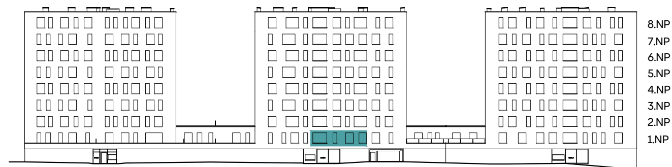
sekce K - Kamila